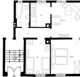
Wohnungsgrundriss (ca. 55 qm)

im 1. Obergeschoß in der Hebelstr. 11 in Kenzingen